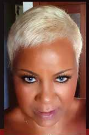
MARINE 06 96 39 85 71